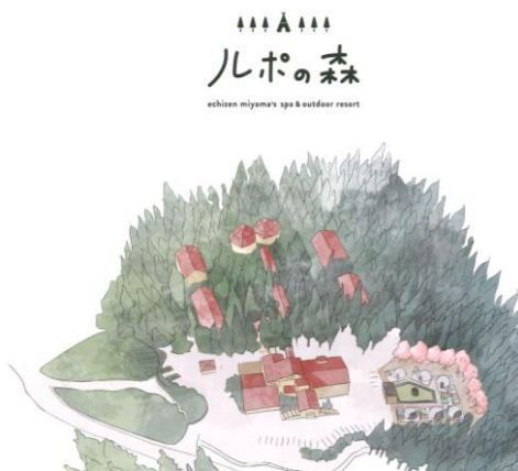
長い階段が印象的なルポの森 宿泊棟

ルポの森の宿泊棟は全館東の部屋にも向き、全ての部屋から大浴場の眺望を望むことができます。 *大浴場の早上には天然温泉の湯船、ルポの森で贅沢なひと時を過ごせます。