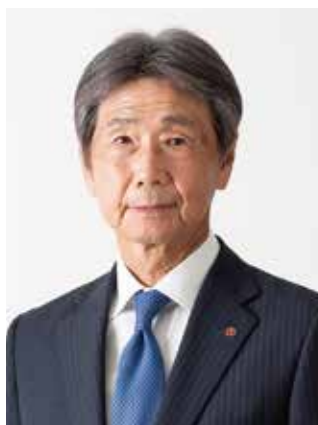
福井県社会保険協会 会長