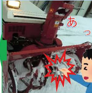
除雪機の刃部との接触