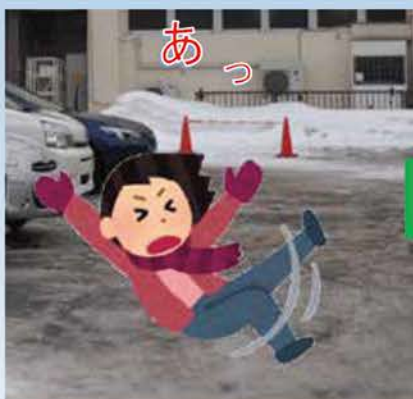
積雪・凍結路面での転倒