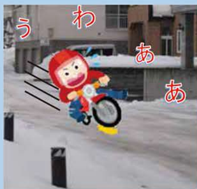
凍結路面での交通事故