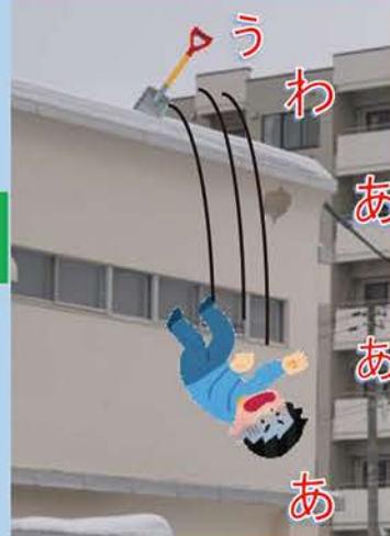
雪下ろし中の墜落